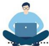
表「薪」情大不同！18學群大學、碩士畢業生起薪大公開