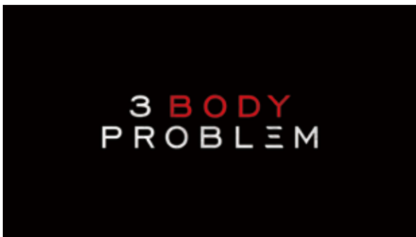
Netflix 《3 體》的片頭字幕。

《3 體》（3 Body Problem）是一部中美合拍耗資數百萬美元的科幻驚悚電視劇集的第一季。它是改編自中國科幻作家劉慈欣的《地球往事三部曲》的第一卷的同名小說英譯本（由華裔美籍科幻作家劉宇昆所翻譯）。這部譯作獲得 2015 年雨果獎（Hugo Award）最佳長篇小說獎，也是第一部獲得該獎的亞洲作家作品。原著三部曲的特色是作者對科學細節的嚴謹關注。改編版在這方面有所欠缺，但仍充滿了科學理念。